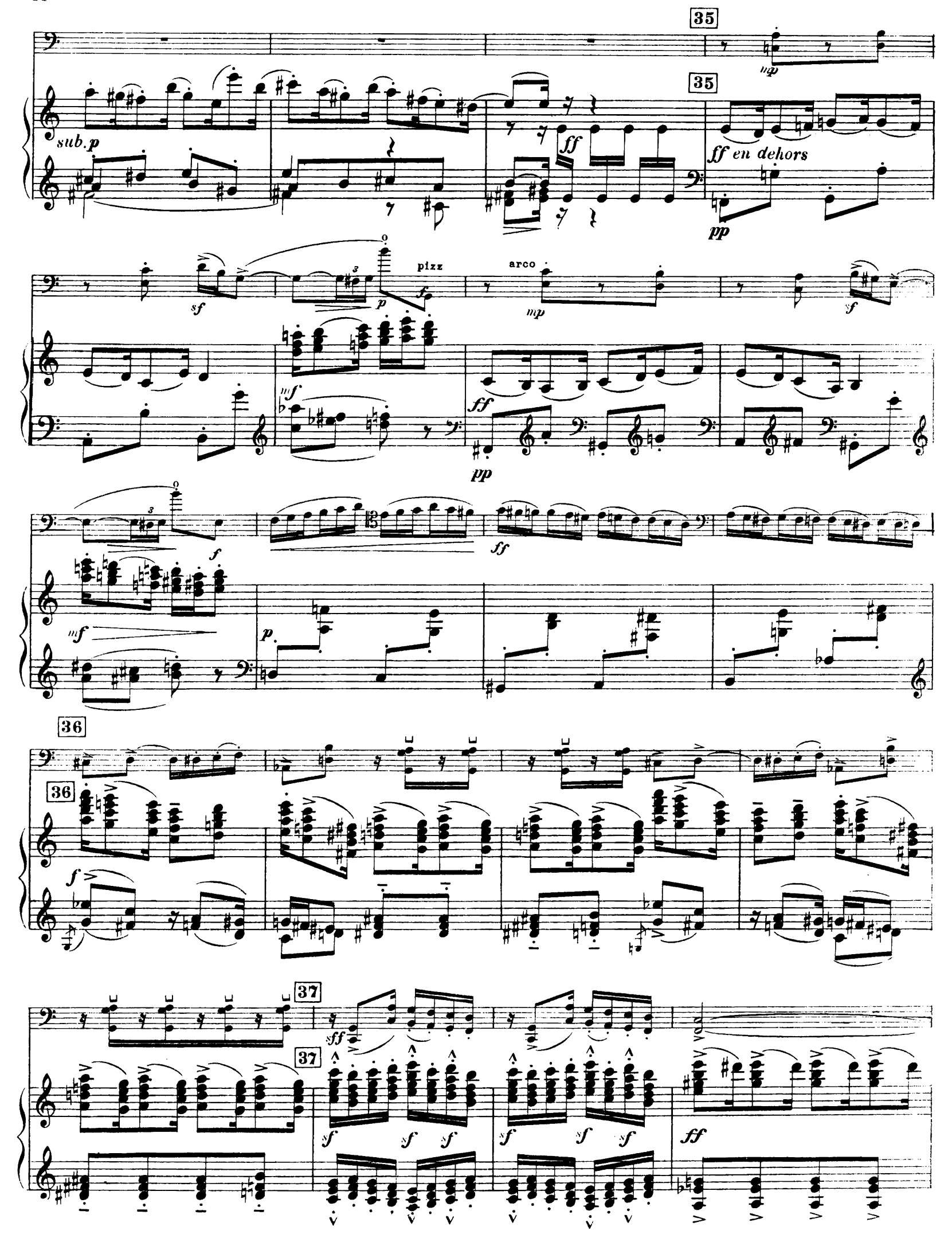
H. 29, 263