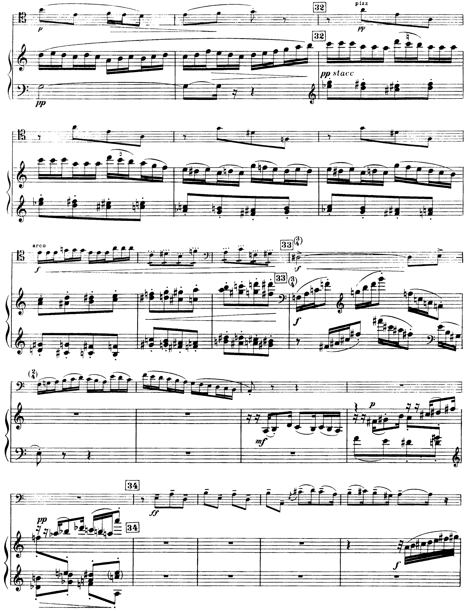
H. 29, 263