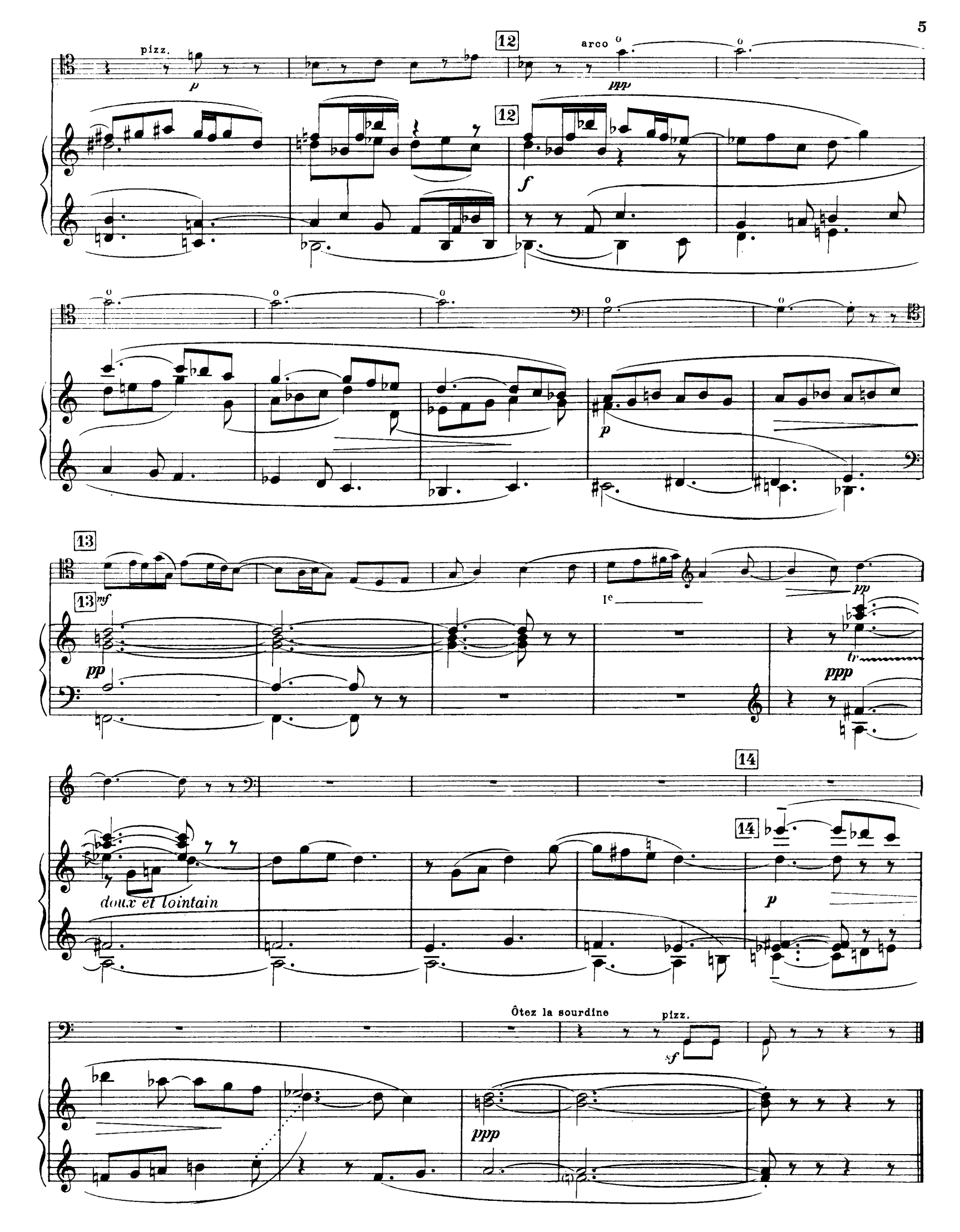
H. 29, 263