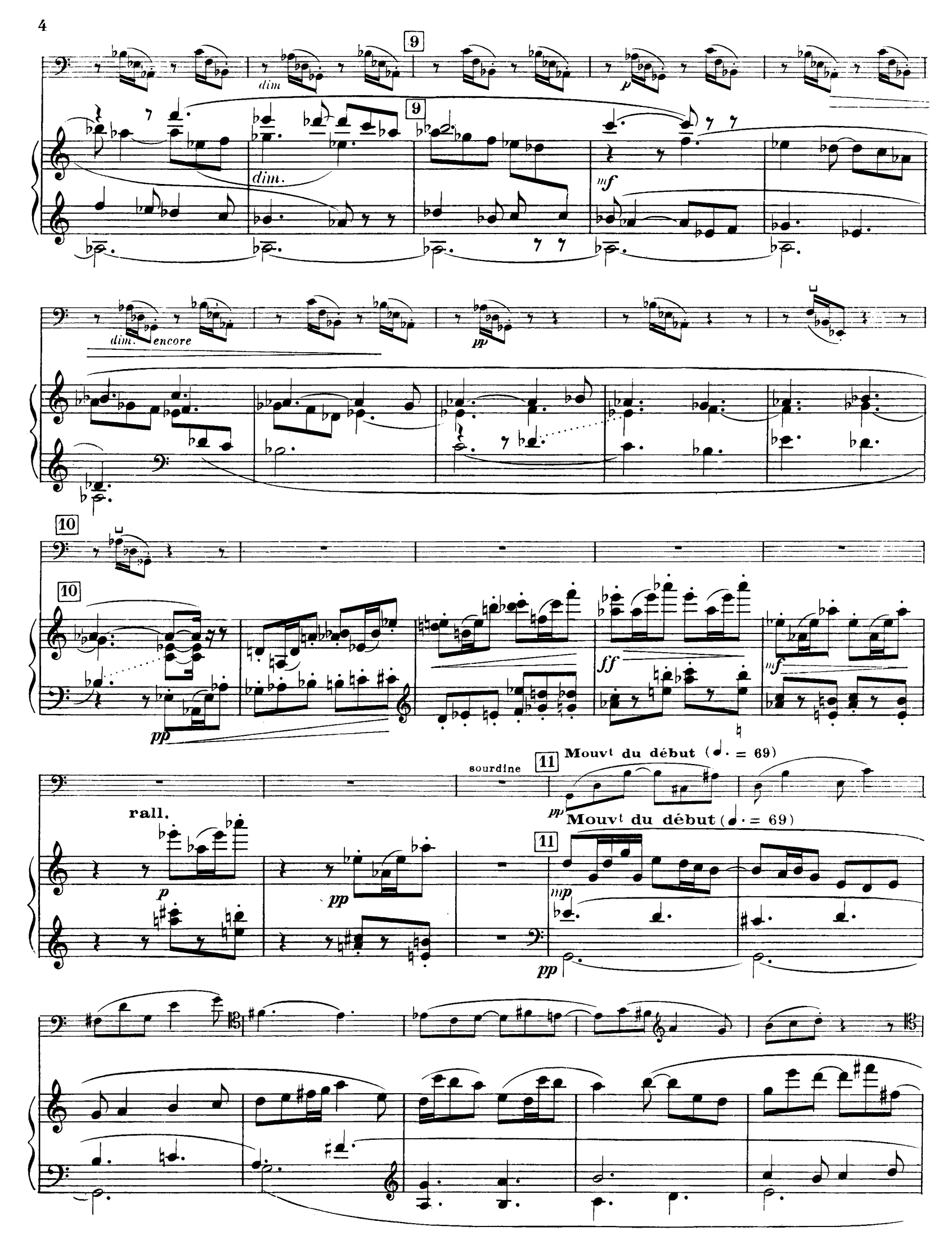
H. 29, 263