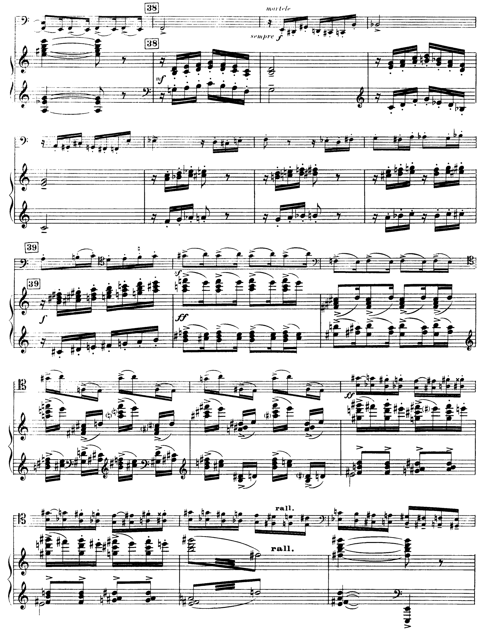
H. 29, 263