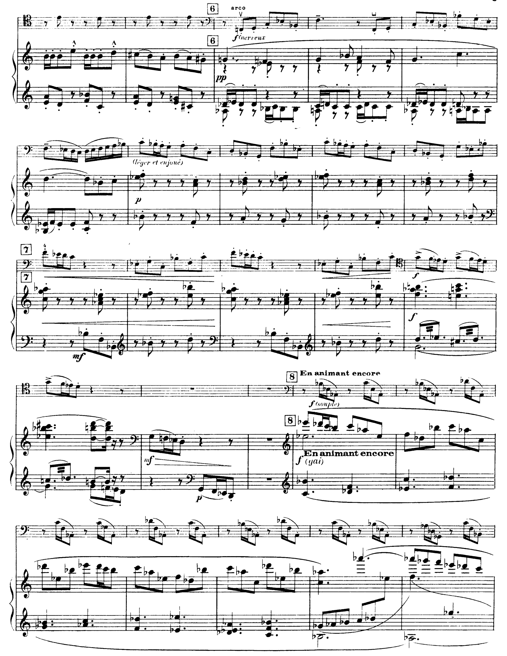
H. 29, 263