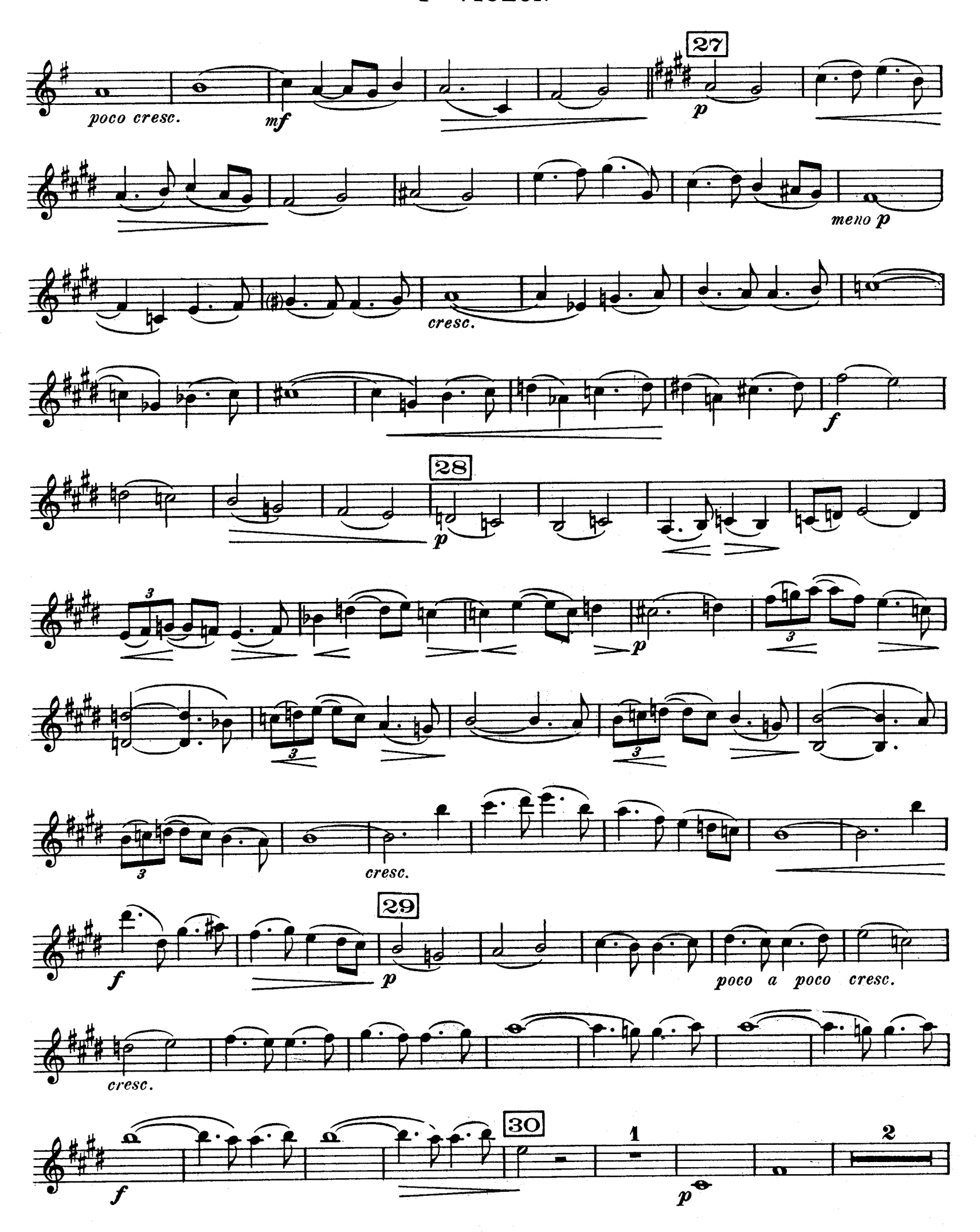
D. F. 10,697