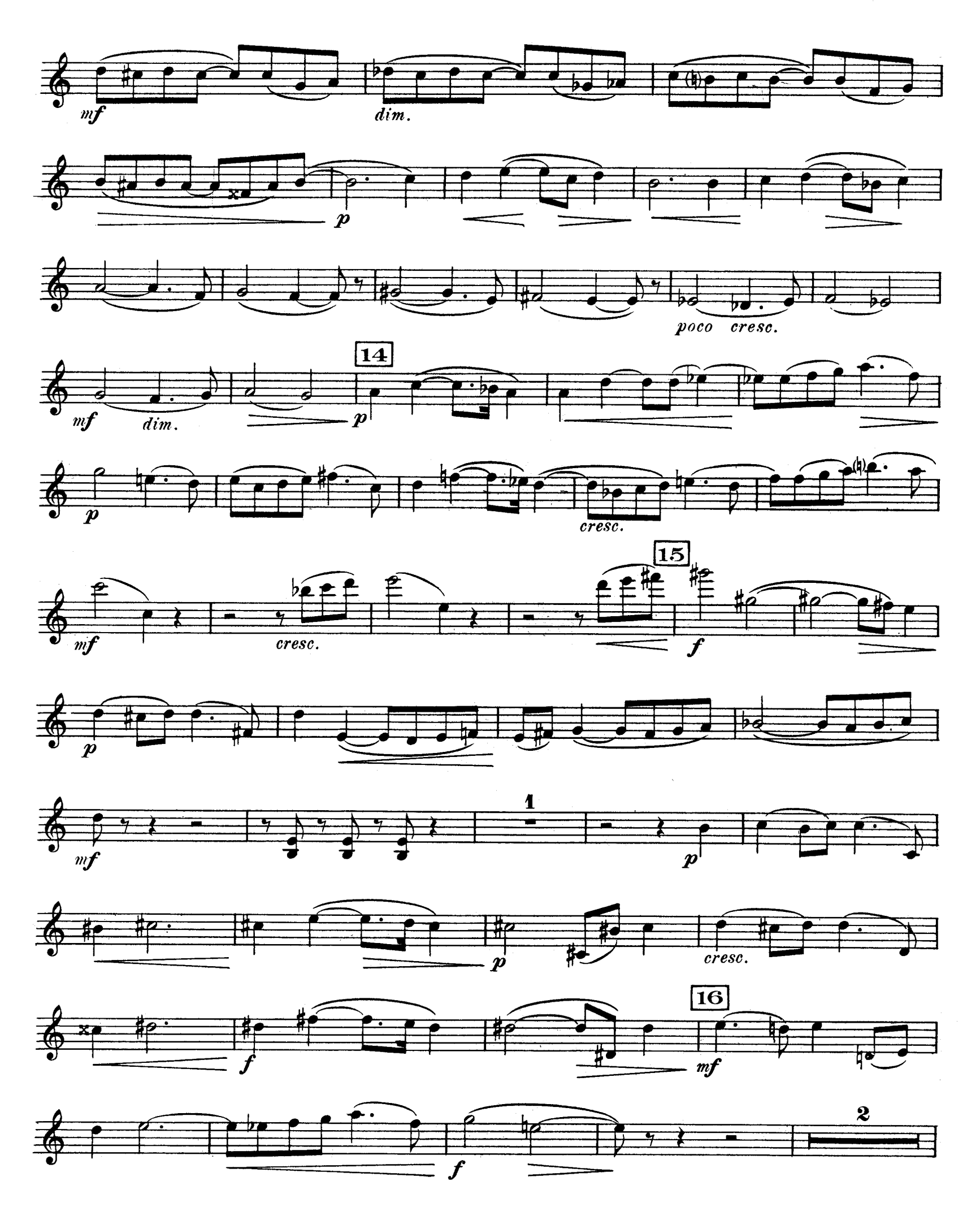
D. F. 10,697