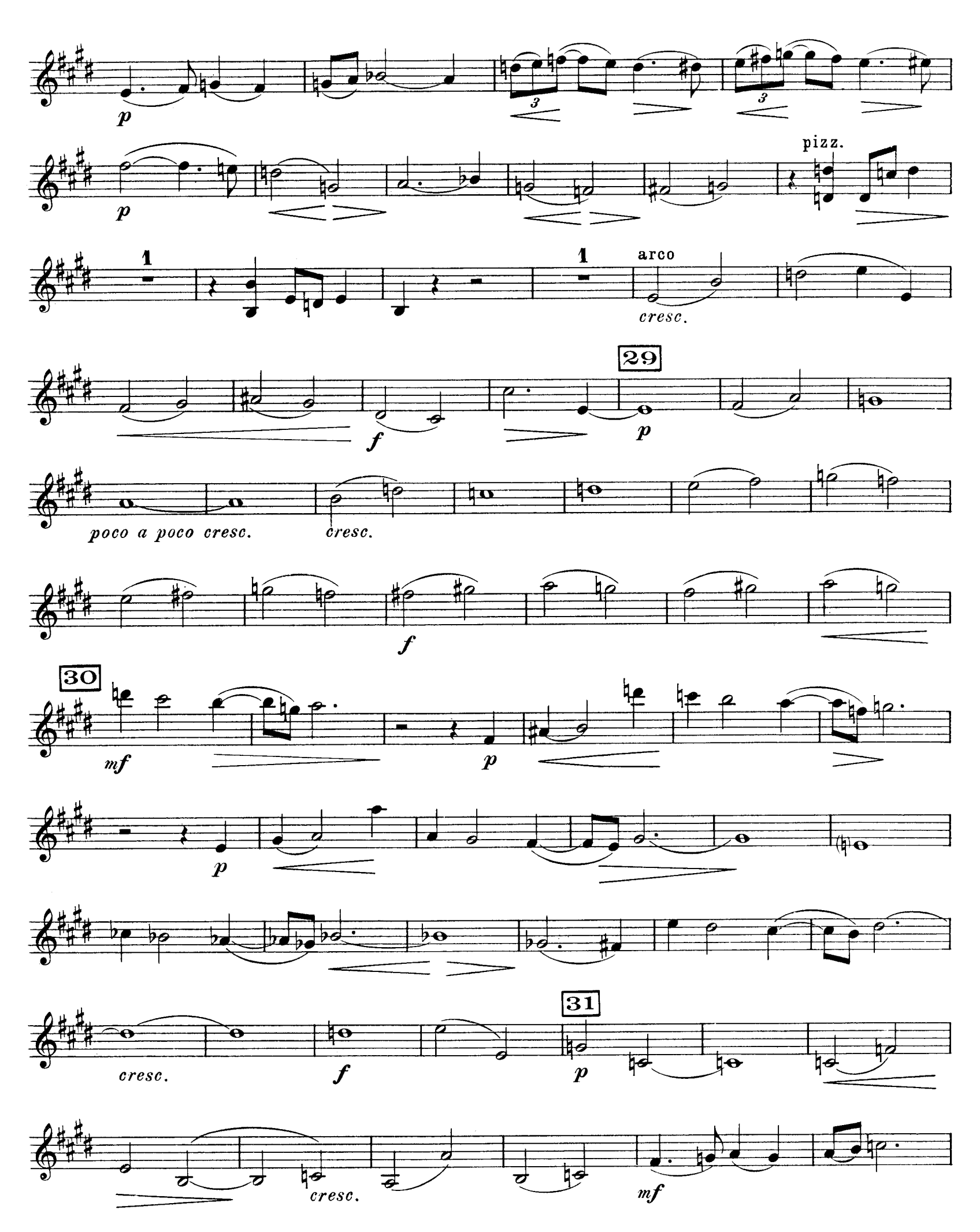
D. & F. 10,697