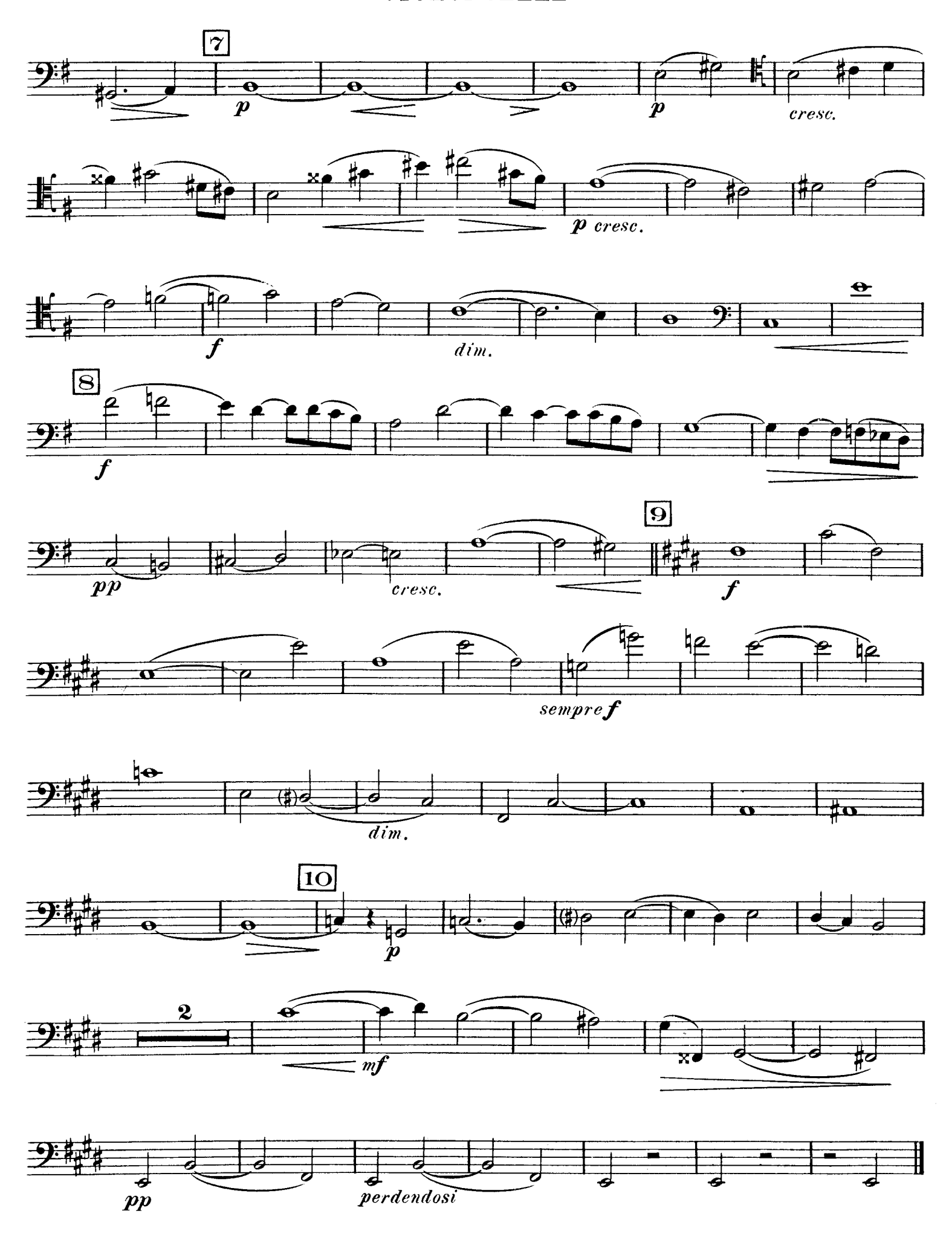
D. & F. 10,697