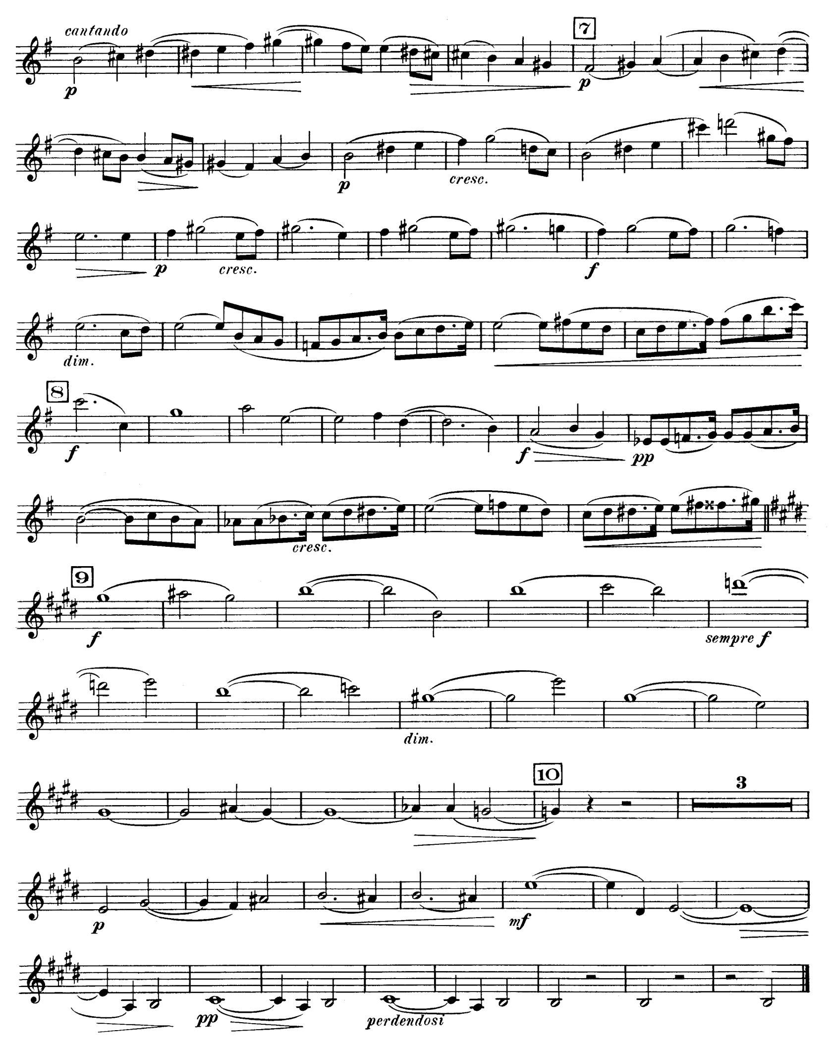
D. F. 10,697