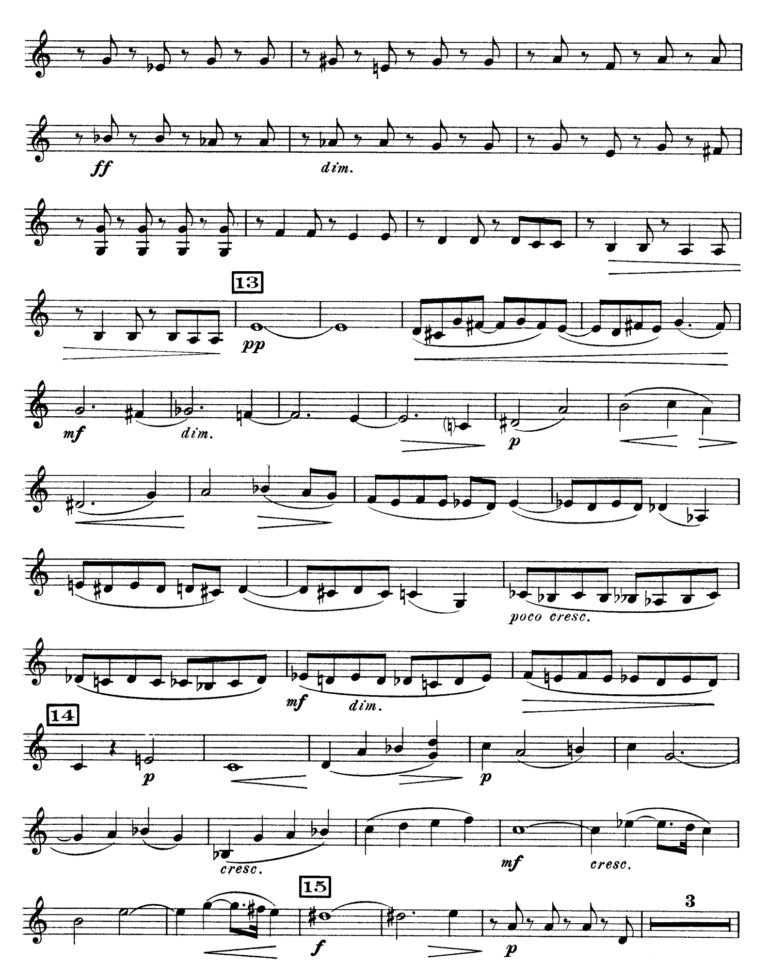
D. & F. 10,697