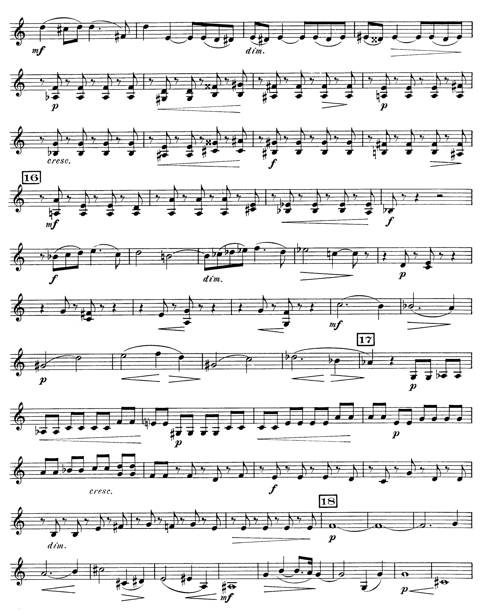
D. & F. 10,697