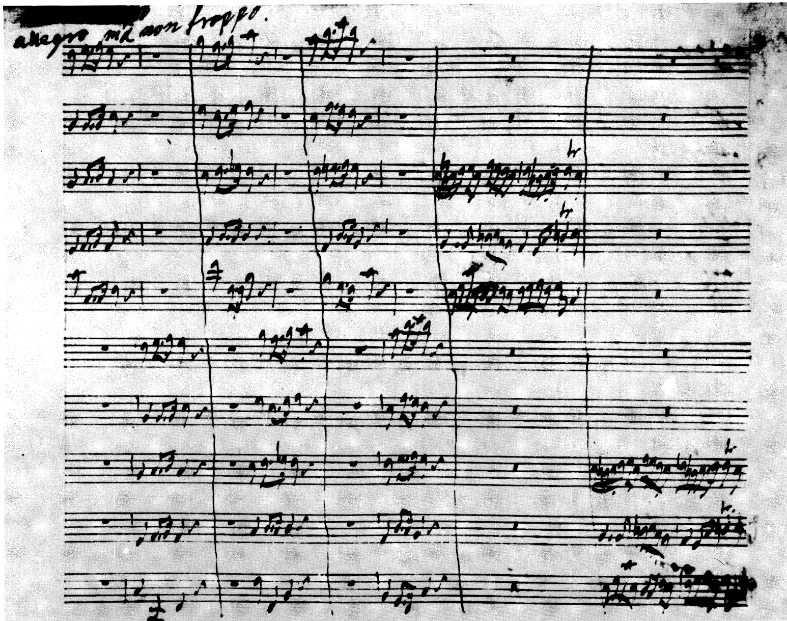
Concerto a due cori F-Dur (HWV 334) Satz 3: Allegro ma non troppo (T. 3 ff.) Autographe Partitur, Fitzwilliam Museum, Cambridge, MS 264, S. 47